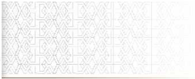
TABLA DE VALORES UNITARIOS DE SUELO Y/O CONSTRUCCIONES VIGENTE, QUE CONSTITUYE LA BASE PARA DETERMINAR EL IMPUESTO A LA PROPIEDAD RAÍZ EN EL MUNICIPIO DE SAN FRANCISCO DE LOS ROMO, AGS. DURANTE EL EJERCICIO FISCAL DEL AÑO 2022.