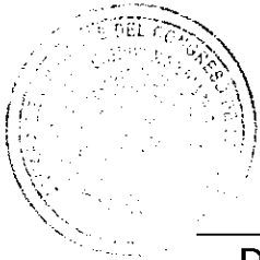
Dip. Porfirio Muñoz Ledo Presidente

S A L Ó N DE SESIONES DE LA CÁMARA DE DIPUTADOS DEL HONORABLE CONGRESO DE LA UNIÓN.- Ciudad de México, a 28 de junio de 2019.